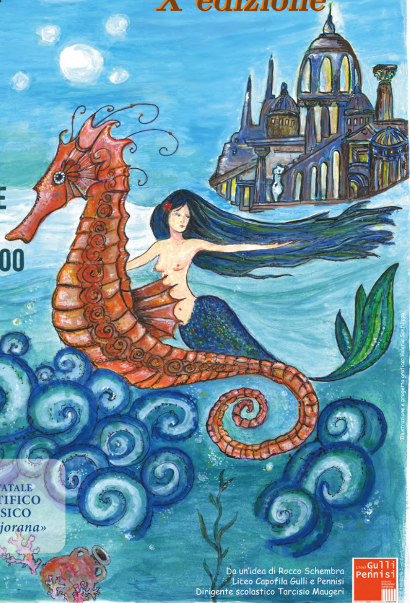
Illustrazione e progetto grafico: Valeria Santilippo